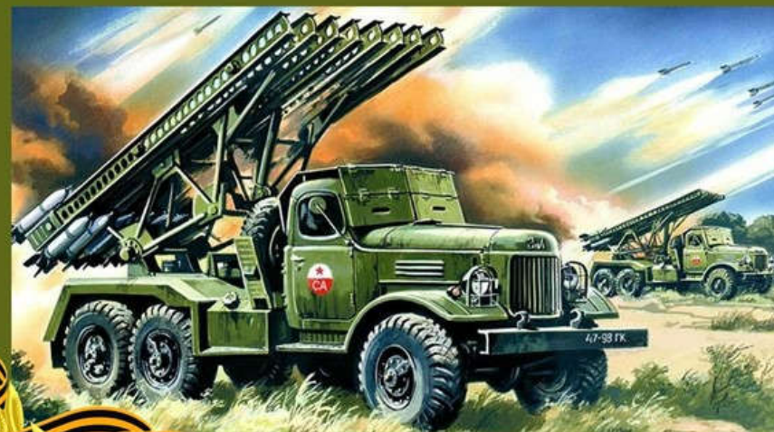
«Катюша» —оружие победы советского народа