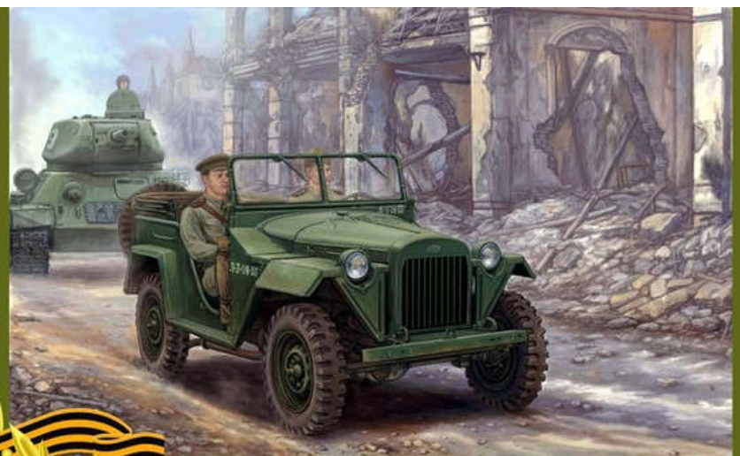
ГАЗ-67. Машина для войны и мира