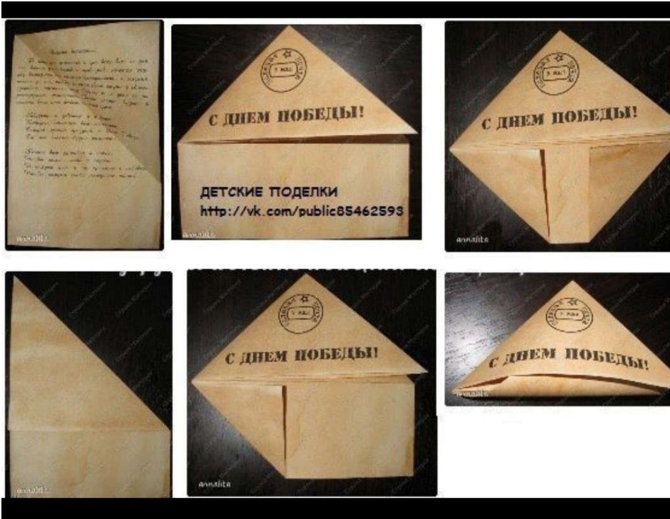
Схема «Фронтное письмо», аппликация «Вечный огонь»